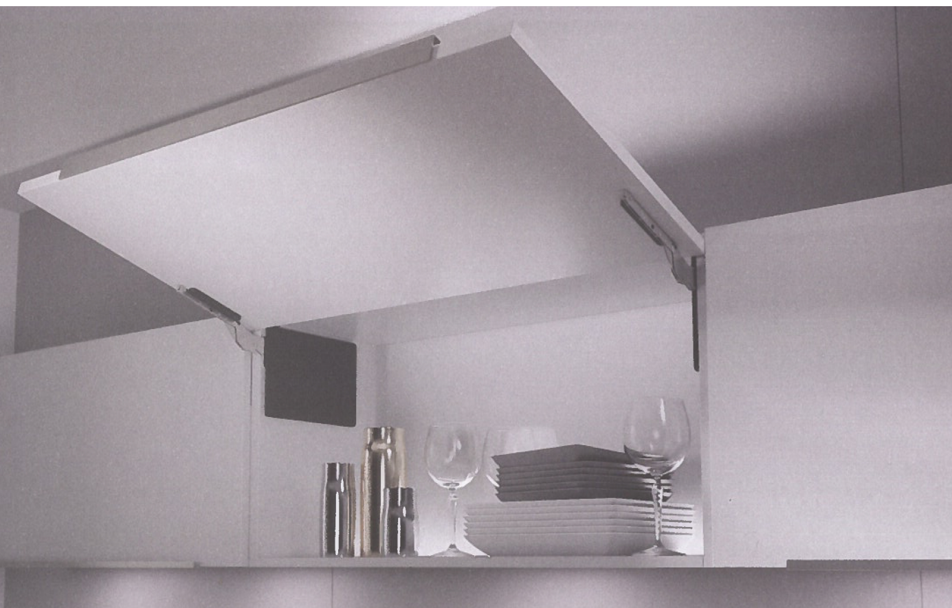
Afdekkappen zijn beschikbaar in antraciet, lichtgrijs en wit, zodat het beslag visueel opgaat in het kastinterieur.

Met FREEslim flap spelen Kesseböhmer en Van Opstal in op een duidelijke trend in interieurbouw: slimme, ruimtebesparende en esthetisch sterke beslagoplossingen die ontwerprijheid vergroten en het dagelijks gebruik verbeteren. ■