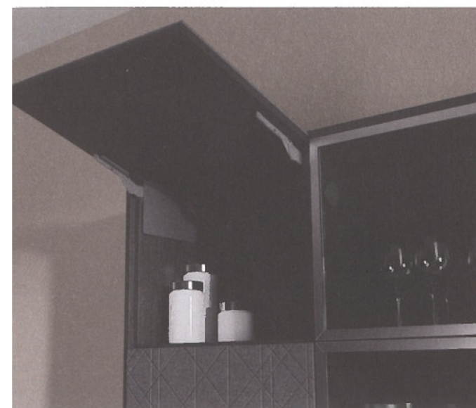
FREEslim flap werd ontwikkeld voor hoge kasten en biedt maximale vrijheid bij montage.

Ook in gebruik is het systeem flexibel. FREEslim flap is beschikbaar in een soft-close uitvoering voor kasten met greep, maar ook