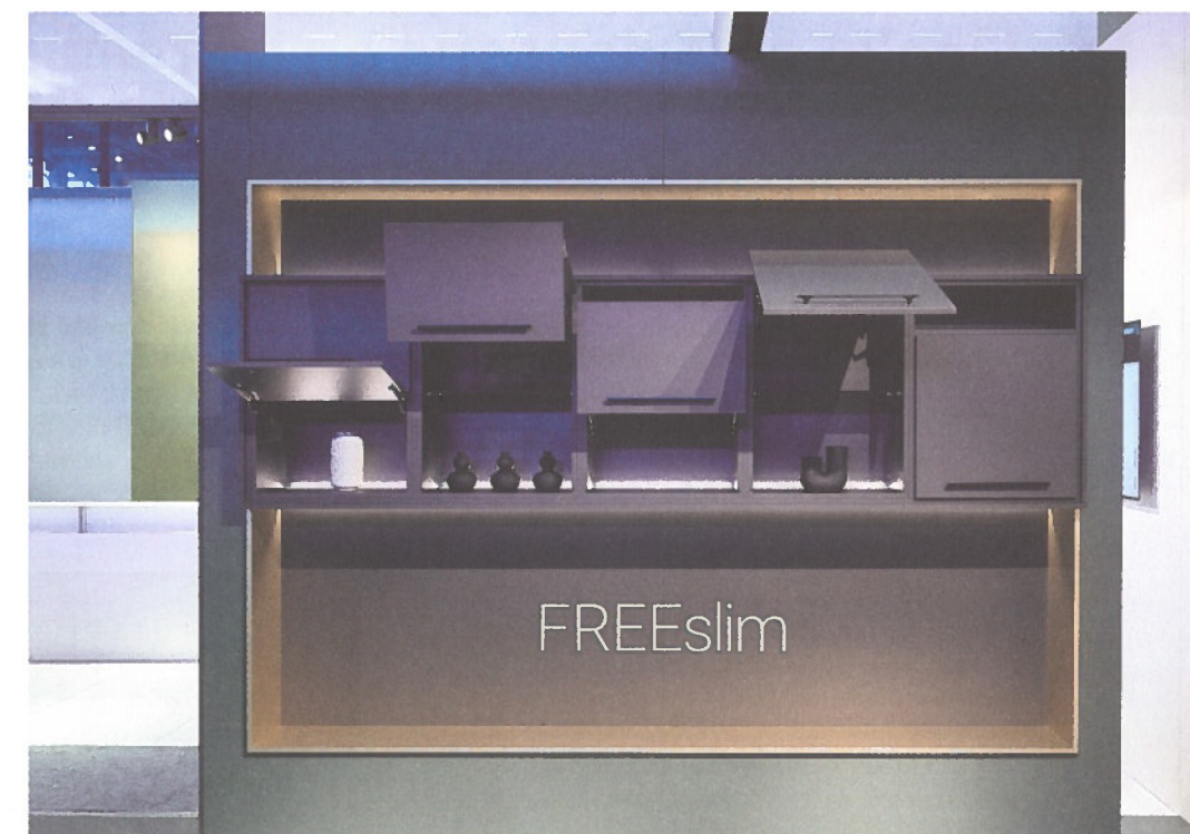
De klep blijft in elke gewenste stand openstaan en beweegt niet verder dan de gebruiker wil.

FREEslim flap is het eerste product binnen een nieuwe FREEslim-familie. "Vandaag lanceren we de klassieke flapversie," besluit Werbrouck, "maar volgend jaar volgen ook